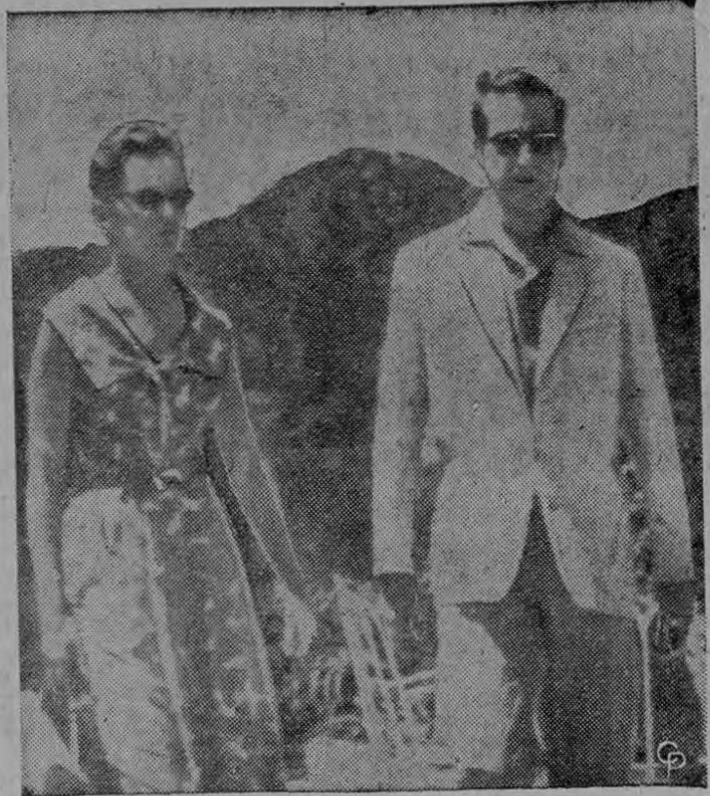
LUNA DE MIEL DE REALEZA.—El príncipe Alberto de Bélgica y su esposa la princesa Paola Ruffo di Calabria, de Italia, pasean por la isla de Mallorca, en el Mediterráneo. Casados con gran pompa en Bruselas, la pareja escogió la playa española para su luna de miel, Alberto es el heredero del trono belga.

MONUMENTO A LA AMISTAD.—La Reina Isabel II de la Gran Bretaña y el Presidente Eisenhower se dirigen a una multitud de 5.000 personas que se reunieron en unas galerías especiales para la inauguración del canal de San Lorenzo, que costó $500.000.000. Hablando en la ceremonia celebrada en las esclusas de St. Lambert, la Reina elogió al "magnífico monumento que realiza la eterna amistad de nuestras dos grandes naciones". El Presidente (fondo), aparece entre los sombreros de los policías de la Real